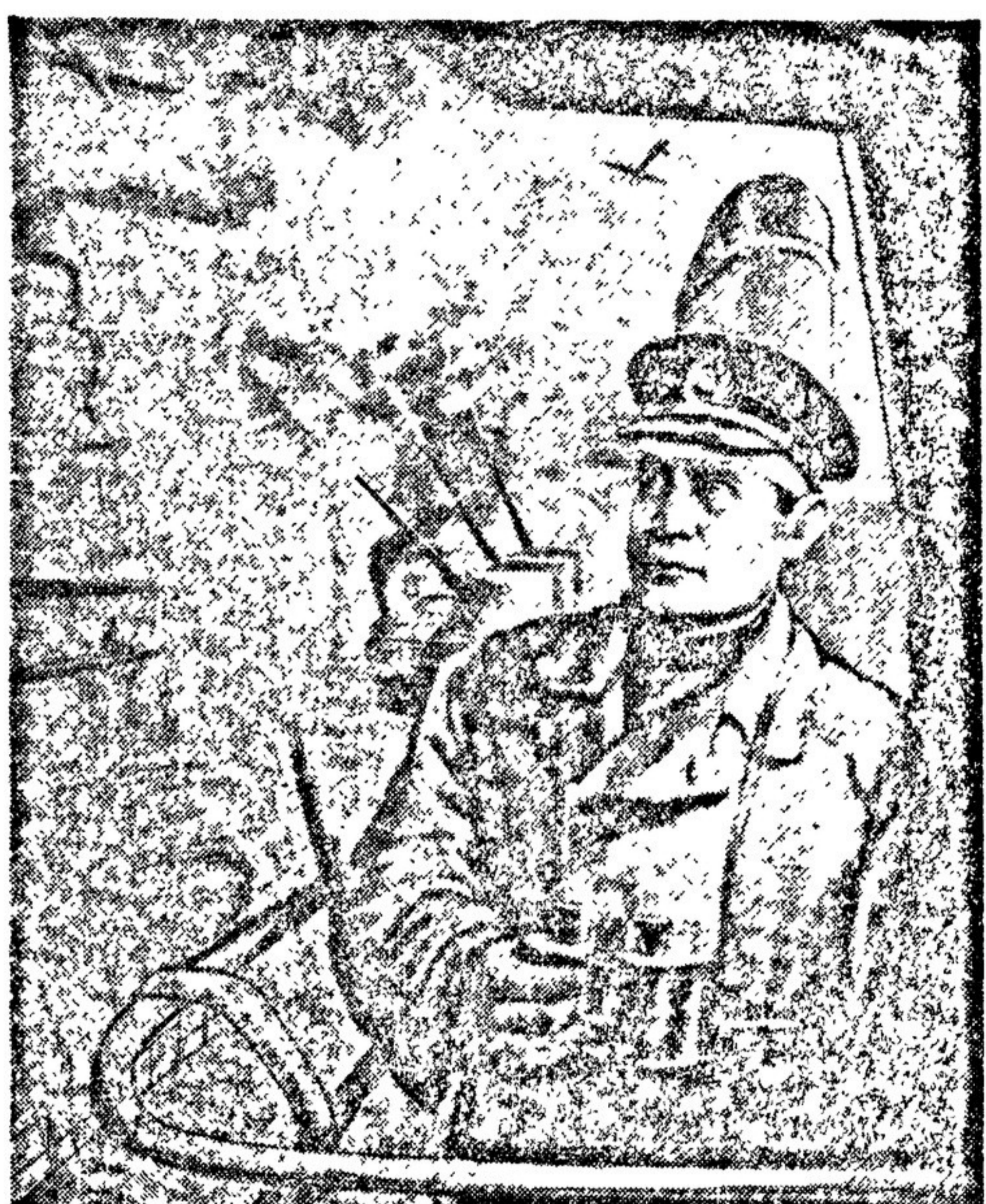
Отражение воздушного шлепа. Рисунок лейтенанта В. СОКОЛОВА. Первая выставка художников Ленинградского фронта.

Героическая защита города Ленинграда в дни блокады и боевые операции войск Ленинградского фронта — такова тема выставки.