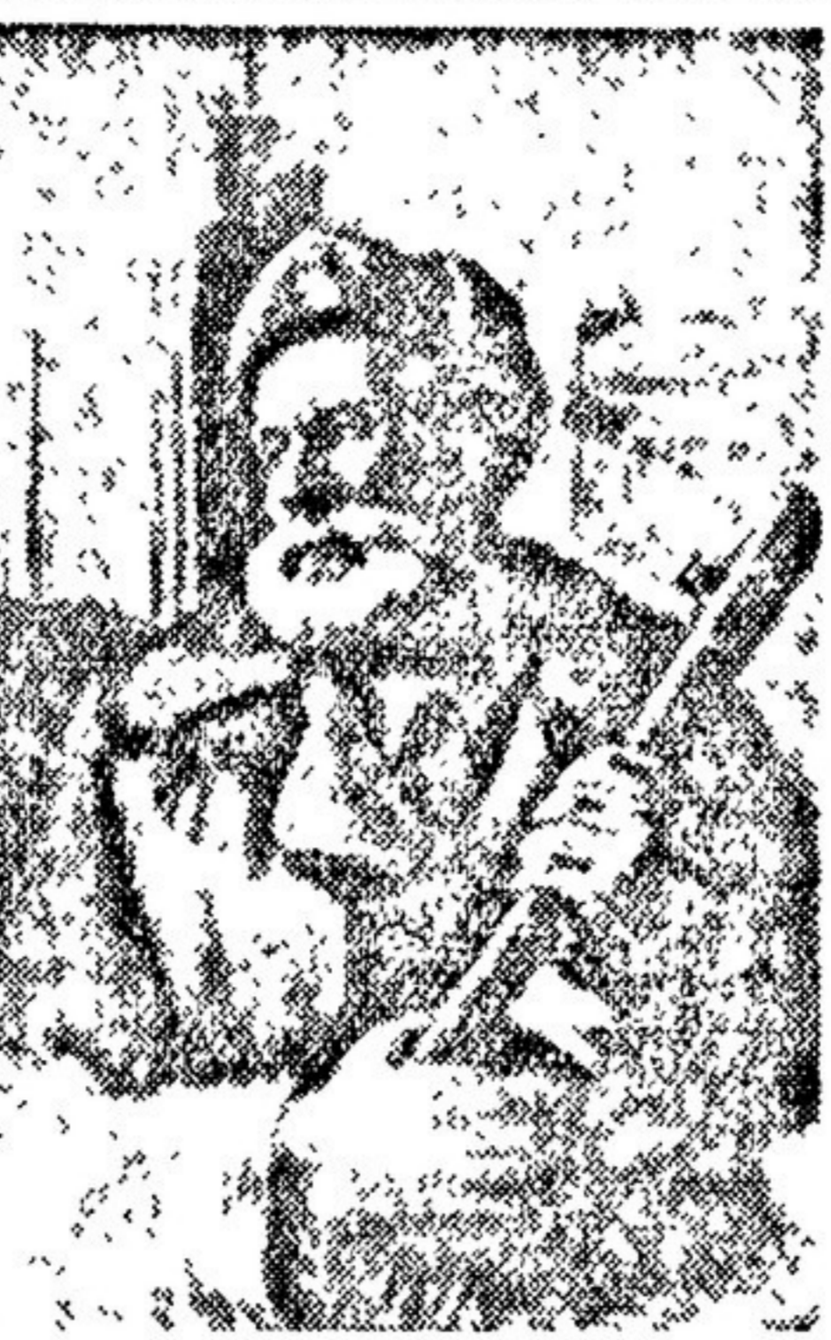
Народный учитель. Художник И. ПУГЛГА. Из новых работ украинских художников.

„Вот это не касается — вот формула жизни в условиях немецкой оккупации. Но формула эта тот же час оказывается несостоятельной — нельзя спасти душу, отгородившись от жизни, нельзя отделиться от жизни, когда все и вся — труд, вера, семья, честь и достоинство — подвержены плутовскому насилию.“