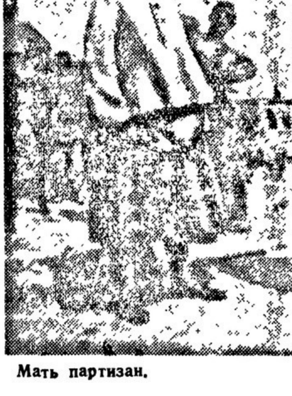
Мать партизан. Картина С. ГЕРАСИМОВА. Выставка „Героический фронт и тыл“.

Как мать, я прошу Вас, товарищи писатели, написать больше таких книг, воспитывающих наших детей так, чтобы они всегда могли противостоять всему зверскому, ложному, грязному.